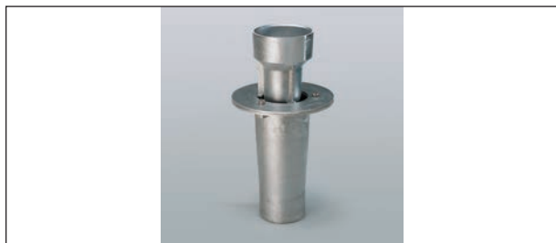
Scurgere continuă pentru balcon