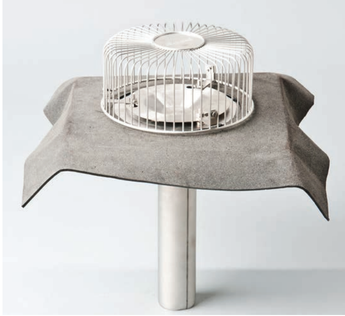
Drenare cu sifon din oțel inoxidabil cu guler din bitum (sus), placă de vacuum și parafrunzar.