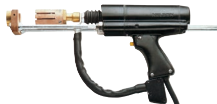
NS 20 BHD "Heavy Duty" pentru sudură cu arc tras