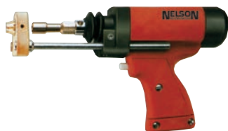
NS 40 B pentru sudură cu arc tras