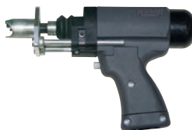
NS 40 SL pentru sudură în ciclu scurt