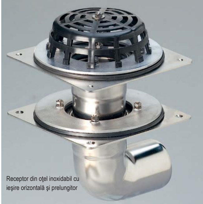
Receptor din oțel inoxidabil cu ieșire orizontală și prelungitor